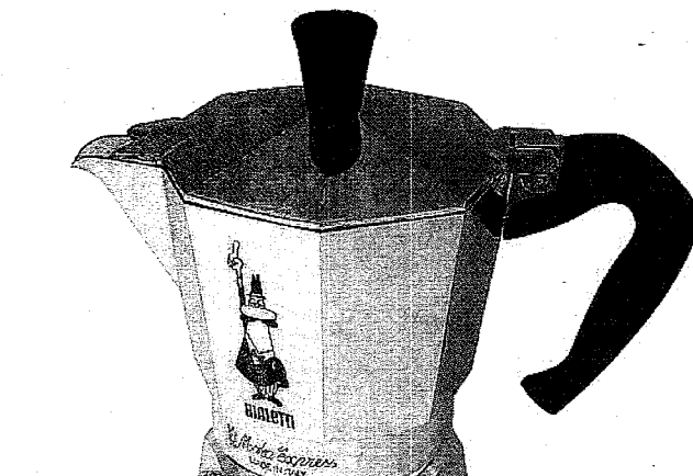
Innovazione italiana La moka ha cambiato il modo di fare il caffè

L'incontro è stato costruito per presentare l'ultimo lavoro di Bucchi, «Per un pugno di idee. Storie di innovazioni che