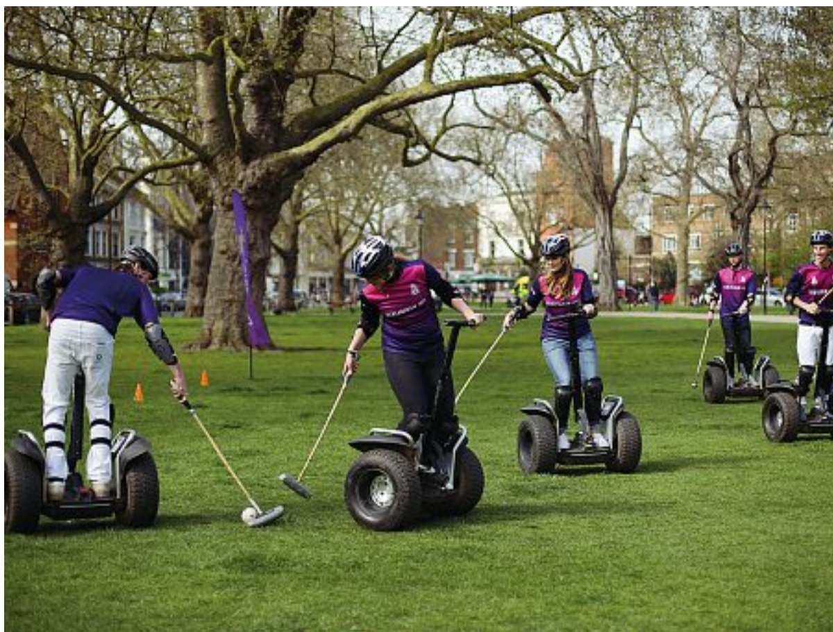
Esempi di flop Il Segway, a destra in alto i Google Glass e sotto Albert Einstein. Tutti casi citati da Bucchi nel saggio

Mescolando con efficacia rigore scientifico, freschezza narrativa e uno sguardo che si nutre di puntuali modulazioni ironiche, l'autore apre il saggio volgendo in interrogativo la classica affermazione «sbagliando s'impara». Dopo aver illustrato gli obiettivi dell'analisi, rimanda quindi diverse questioni al poscritto, formulato ancora una volta in modo interrogativo: possiamo non sbagliare? Ecco il caso della Kodak, che alla metà degli anni Settanta significava il novanta per cento delle pellicole fotografiche utilizzate in tutto il mondo e nel 2012 è finita in bancarotta. Oppure il flop del Segway e il rigore sbagliato da