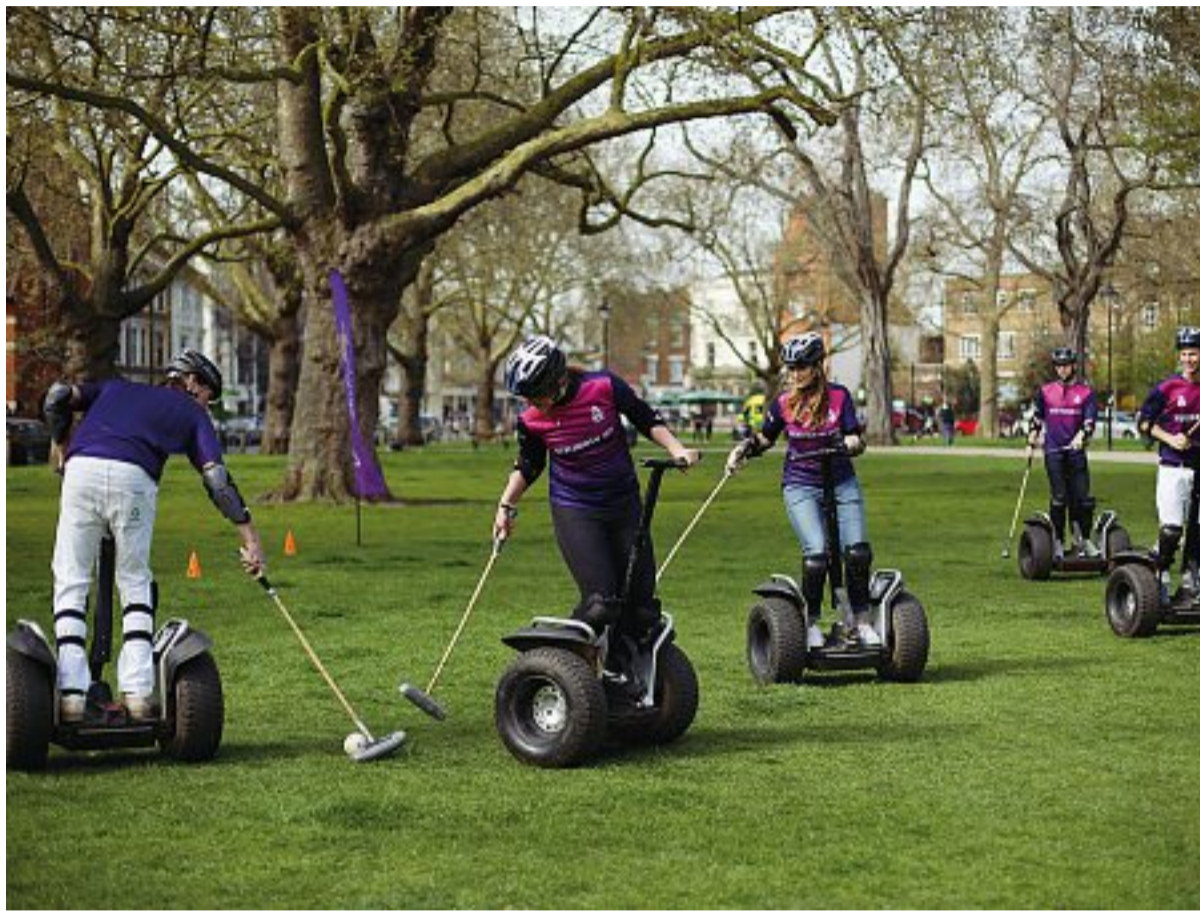
Esempi di flop Il Segway, a destra in alto i Google Glass e sotto Albert Einstein. Tutti casi citati da Bucchi nel saggio

Mescolando con efficacia rigore scientifico, freschezza narrativa e uno sguardo che si nutre di puntuali modulazioni ironiche, l'autore apre il saggio volgendo in interrogativo la classica affermazione «sbagliando s'impara». Dopo aver illustrato gli obiettivi dell'analisi, rimanda quindi diverse questioni al poscritto, formulato ancora una volta in modo interrogativo: possiamo non sbagliare? Ecco il caso della Kodak, che alla metà degli anni Settanta significava il novanta per cento delle pellicole fotografiche utilizzate in tutto il mondo e nel 2012 è finita in bancarotta. Oppure il flop del Segway e il rigore sbagliato da