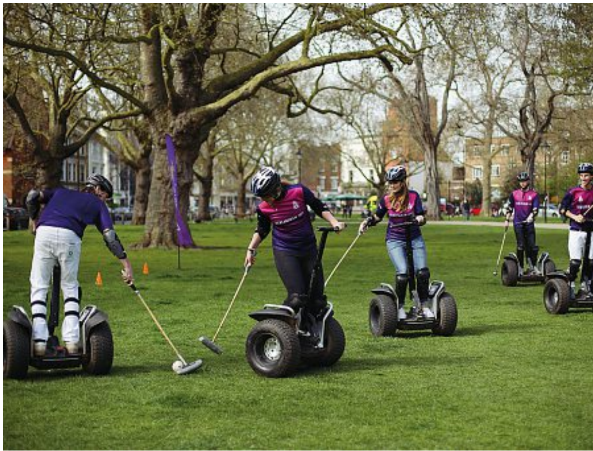
Esempi di flop Il Segway, a destra in alto i Google Glass e sotto Albert Einstein. Tutti casi citati da Bucchi nel saggio

Mescolando con efficacia rigore scientifico, freschezza narrativa e uno sguardo che si nutre di puntuali modulazioni ironiche, l'autore apre il saggio volgendo in interrogativo la classica affermazione «sbagliando s'impara». Dopo aver illustrato gli obiettivi dell'analisi, rimanda quindi diverse questioni al poscritto, formulato ancora una volta in modo interrogativo: possiamo non sbagliare? Ecco il caso della Kodak, che alla metà degli anni Settanta significava il novanta per cento delle pellicole fotografiche utilizzate in tutto il mondo e nel 2012 è finita in bancarotta. Oppure il flop del Segway e il rigore sbagliato da