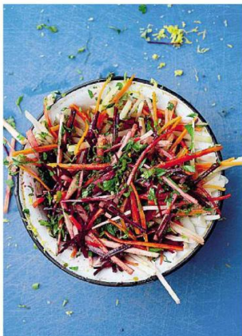
Yotam Ottolenghi (in foto) e Sami Tamimi, Jerusalem, Giunti, 318 pagine, 37 euro, dal 6 marzo

La nuova edizione italiana di «Jerusalem»: il terzo ricettario, oggi più che mai attuale, dello chef israeliano Yotam Ottolenghi scritto con il suo socio palestinese Sami Tamimi